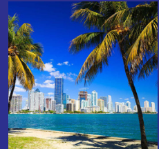
Miami Junio 2023