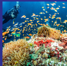
Riviera Maya Julio 2023