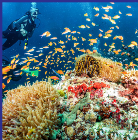
El medio ambiente marino y arrecifes de coral.

La Fundación Planet Future ha sido creada con 4 objetivos muy bien definidos: