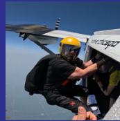
Paracaidista titulado por USPA