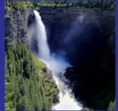
British Columbia Abril 2022