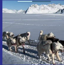
Groenlandia e Islandia Marzo 2022

A continuación se enumeran algunas de las expediciones y viajes ya realizados y programados para 2024.