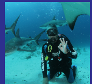
Instructor de Buceo por PADI