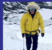
Explorador Climático 80+ países visitados