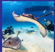
Azores Agosto 2024