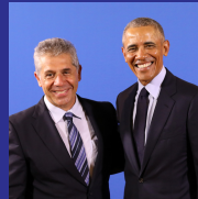
Presidente Obama Portugal 2018

Pancho Campo ha colaborado con numerosos líderes mundiales, deportistas, artistas y celebridades.