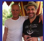
Sting Italia, 2011