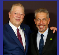
VP Al Gore Gibraltar 2013