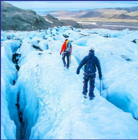
El Ártico, Groenlandia, la Antártida y glaciares.