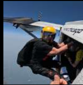
Paracaidista Titulado por USPA