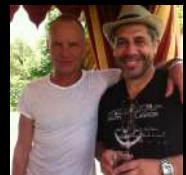
Sting Italia, 2011