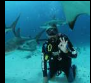
Buceador PADI Instructor