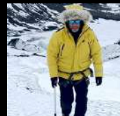
Explorador Climático 80+ países visitados