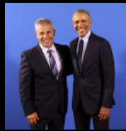
Presidente Obama Portugal 2018

Pancho Campo ha colaborado con numerosos líderes mundiales, personalidades del deporte, artistas y celebridades.