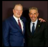
VP Al Gore Gibraltar 2013